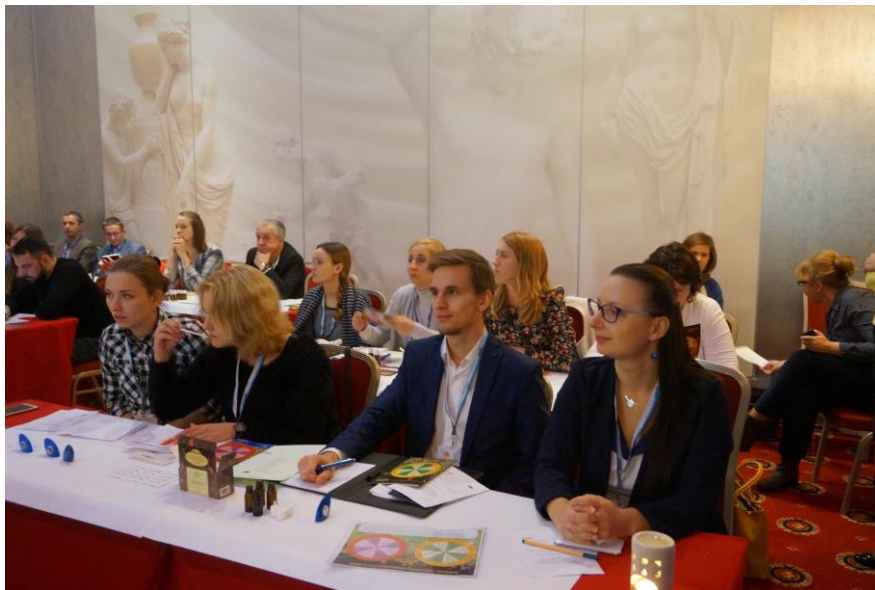
Fot. 4 Uczestnicy w trakcie warsztatów „Tajemnice aromaterapii”