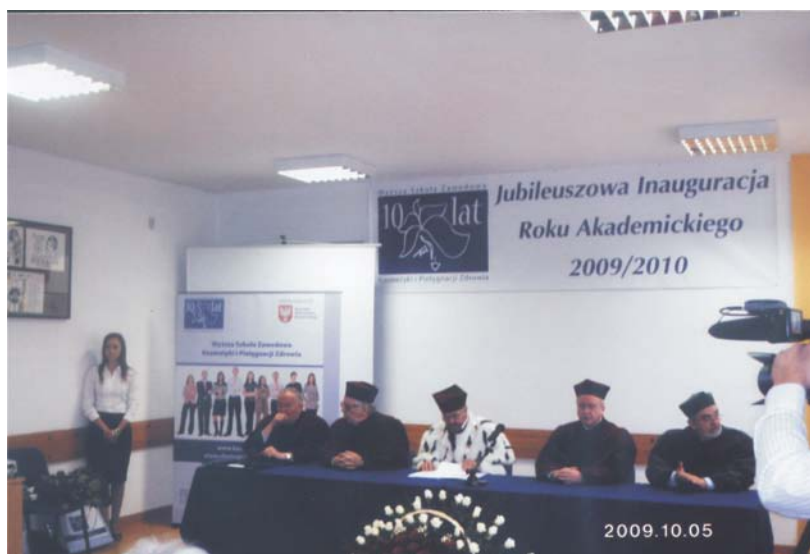
Fot. 1. W Wyższej Szkole Zawodowej Kosmetyki i Pielęgnacji Zdrowia. Inauguracja roku akademickiego 2010 r.

Podsumowując 20 lat naszej działalności z dużą satysfakcją możemy chyba powiedzieć, że dzięki naszym działaniom aromaterapia w Polsce stała się metodą nie tylko dostępną ale również bezpieczną dla wszystkich miłośników tej pachnącej sztuki pielęgnacji ciała i ducha.