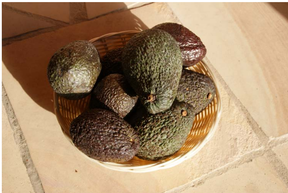
Fot.2 Owoce awokado

słonecznikowy itp. W języku angielskim i francuskim nie ma takiego rozróżnienia i w obu przypadkach używa się tego samego określenia – odpowiednio „oil”, „huile”. Zarówno olejki eteryczne jak i oleje roślinne są bardzo wartościowe, ale spełniają zupełnie inną rolę w wyrobach kosmetycznych i aromaterapeutycznych. Podobnie jest w kuchni – olejków eterycznych (pomarańczowy, cytrynowy itd.) używa się jako aromatów, a oleje służą np. do smażenia czy do sałatek. Nie mylmy więc pachnących „olejków eterycznych” z bezwonnymi „olejami tłuszczowymi”.