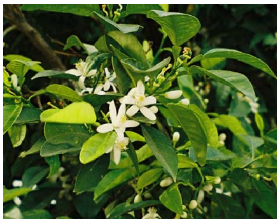
Fot. 3. Kwiat pomarańczy.

W oparciu o normy można łatwo sprawdzać jakość olejków.