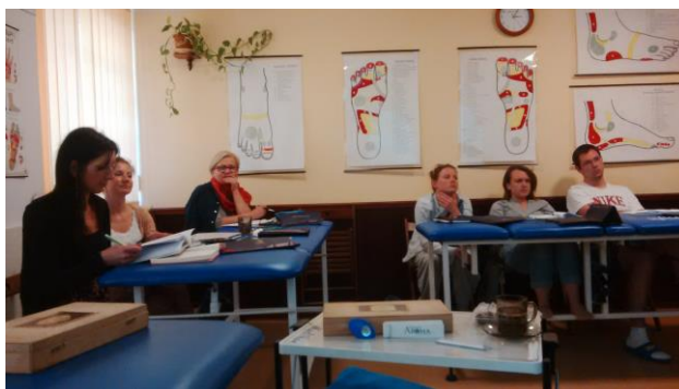
Fot. 1 Słuchawka