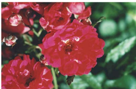
Fot. 1 Róża damasceńska

Naturalne olejki z pachnących kwiatów róży damasceńskiej ( Rosa damascena , nazwa wg INCI Rosa Damascena Flower Oil) i kwiatów drzewa pomarańczowego, nazwanego od miejscowości Nerola we Włoszech olejkim neroli ( Citrus Aurantium , nazwa według INCI Citrus Aurantium Amara Flower Oil) pełnią bardzo ważną rolę w pielęgnacji skóry twarzy.