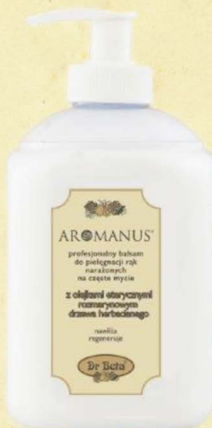
Butelka 500ml z dozownikiem